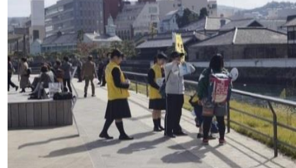
ミッフィーにタッチ