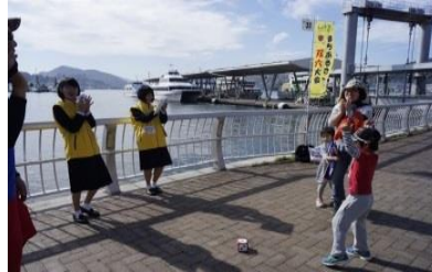
長崎港ターミナル