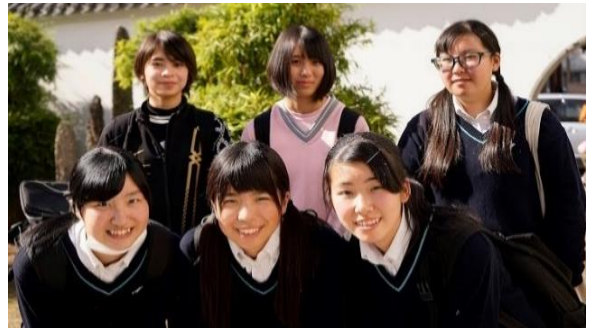
長崎明誠高等学校