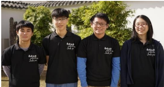
長崎大学ジャグリング部 「Jackpot」