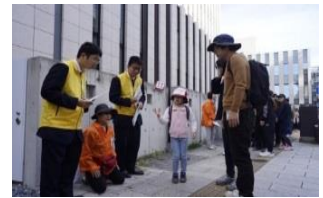
気球飛揚発祥の地