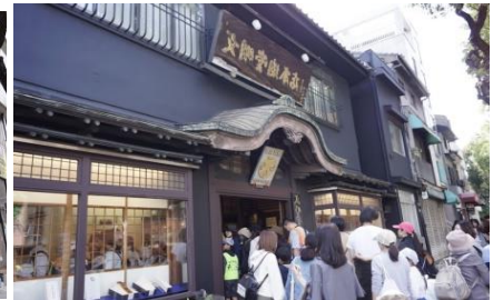
文明堂カステラ試食