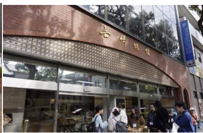
長崎物語おたくさ試食