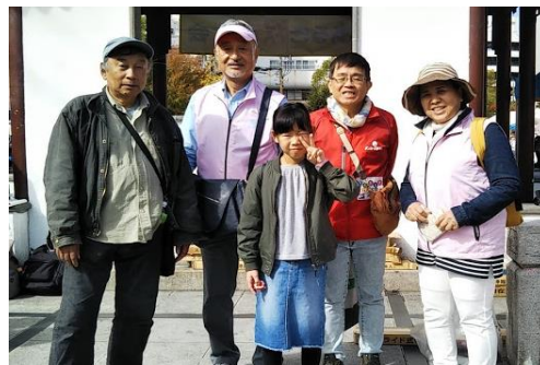
ながさきダンカーズ倶楽部