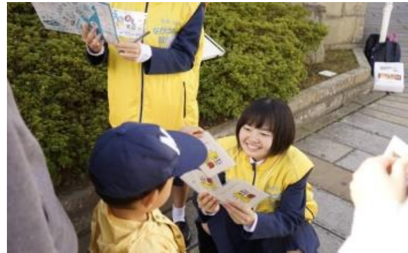
ベルビューホテル トランプ