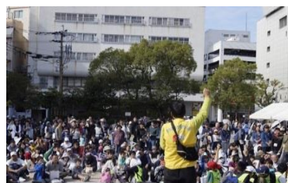
ダブルチャンス抽選会