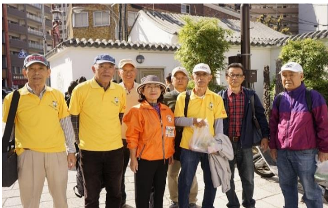
長崎さるくガイド

このほか、さるくガイドの皆様、一般社会人、ボランティア団体、実行委員OB等々たくさんの方々のご協力をいただきました。ありがとうございました。