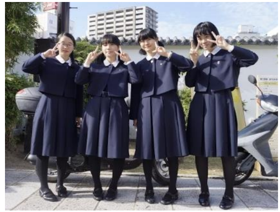
純心女子高等学校