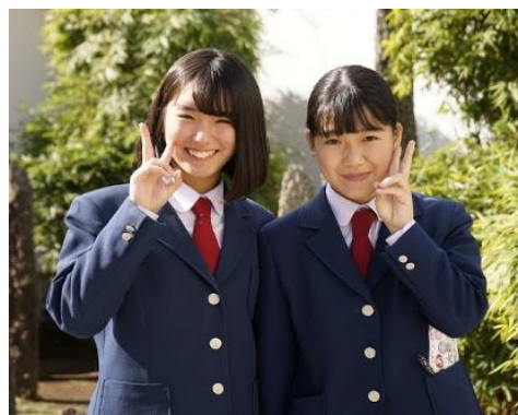
長崎工業高等学校