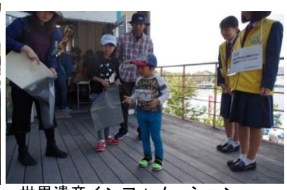
世界遺産インフォメーション センター クラフト等グッズ配布