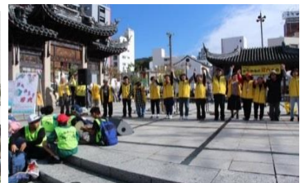
実行委員お礼表明