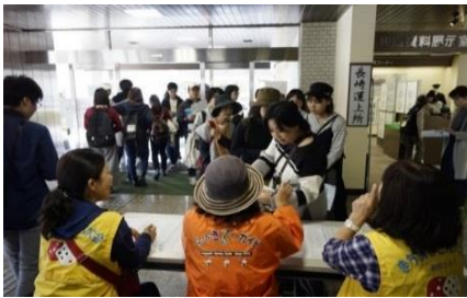
チェックポイント 税関内