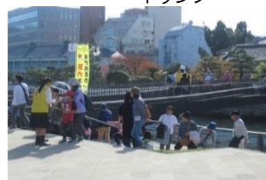
オランダ生まれのミッフィーにタッチ