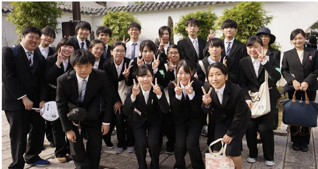
長崎高等技術専門校