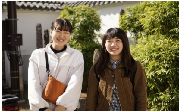
長崎県立大学シーボルト校