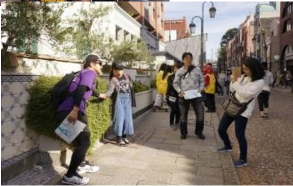
ハート型植え込みで記念写真