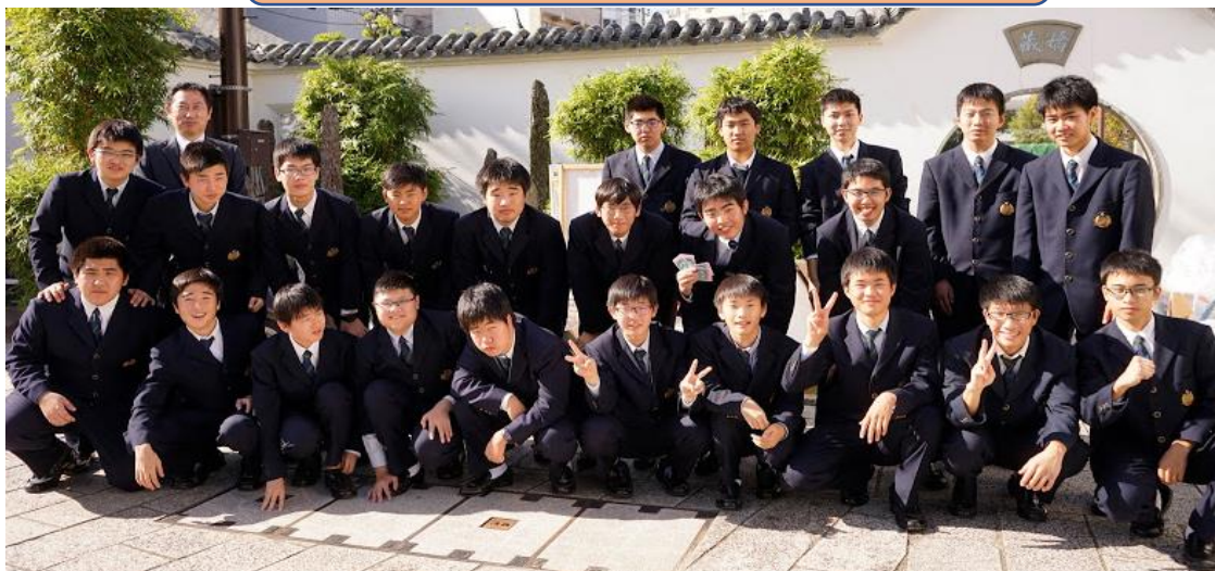
長崎南山高等学校