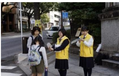
南蛮船トライの波止場跡 トランプ