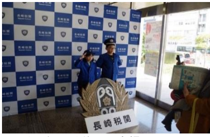
税関制服試着 記念撮影