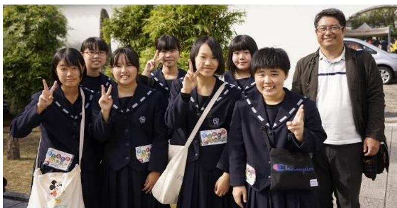
長崎女子高等学校