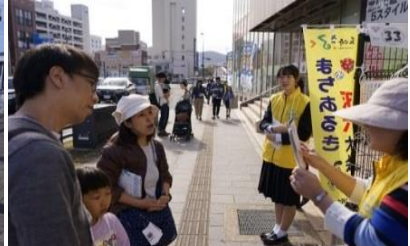
長崎の七不思議おみくじ