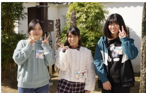
長崎女子短期大学