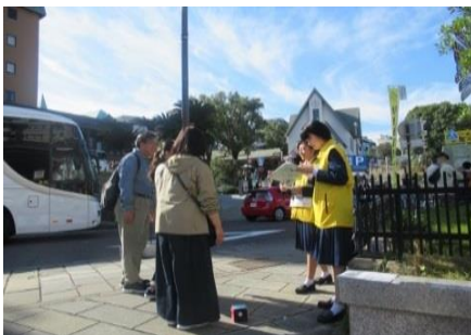
ボウリング発祥の地